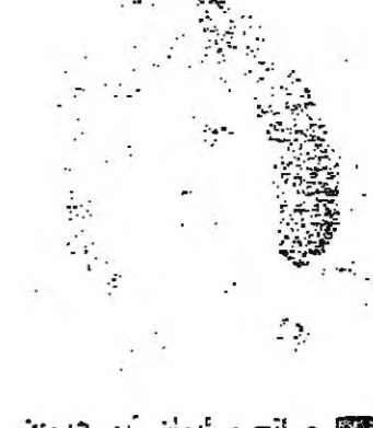
صالح مكيان أبو حسين